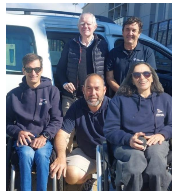
Equipa de competição de vela adaptada e o treinador

6 a 13 de setembro | Barcelona | Campeonato da Europa de Hansa