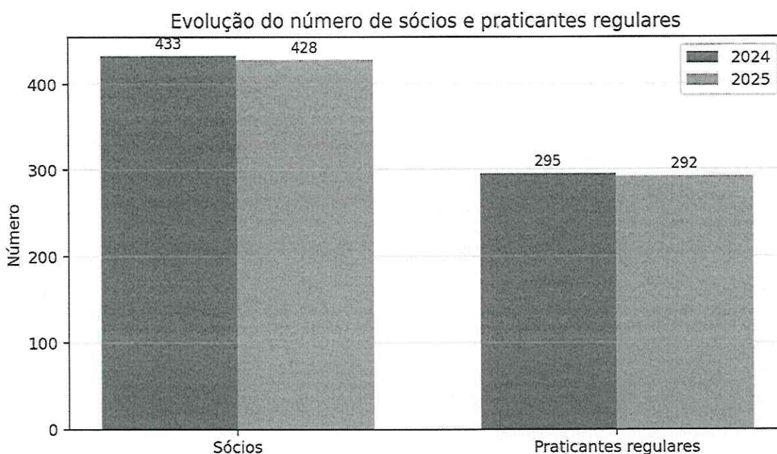
Gráfico 1 — Evolução do número de sócios e praticantes regulares.

Dos 292 praticantes regulares, 52% pertencem à classe de lazer, confirmando a importância desta vertente enquanto espaço de prática desportiva regular, convívio, integração e permanência no clube.