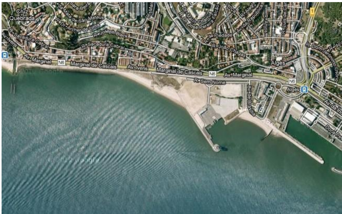
Campo A - Baía de São José de Ribamar – Algés